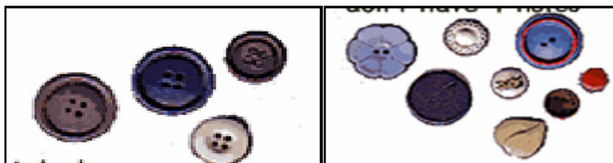
Gambar 3. Mengelompokkan kancing yang berlubang 4 dan yang tidak berlubang 4

Pengetahuan tentang grafik merupakan bentuk perluasan dari memilih dan mengelompokan. Membuat grafik merupakan cara anak untuk menampilkan bermacam-macam informasi/data dalam bentuk yang berlainan.