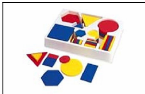
Gambar 6. Menyebutkan Nama Bentuk

Geometri dan Mencipta Aneka Bentuk dengan Menggunakan Bentuk Geometri.