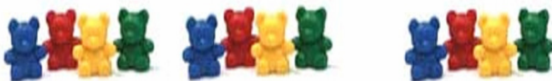
Gambar 2. Mengurutkan Pola Berdasarkan Warna