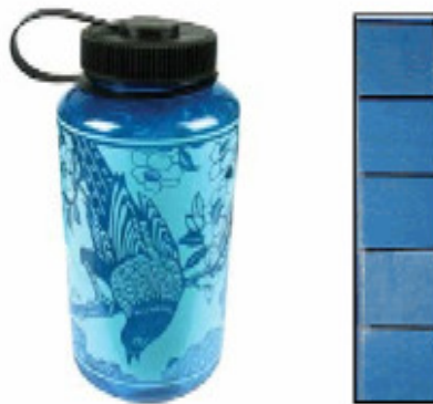
Gambar 5. Mengukur Tinggi Botol dengan Alat Ukur Balok