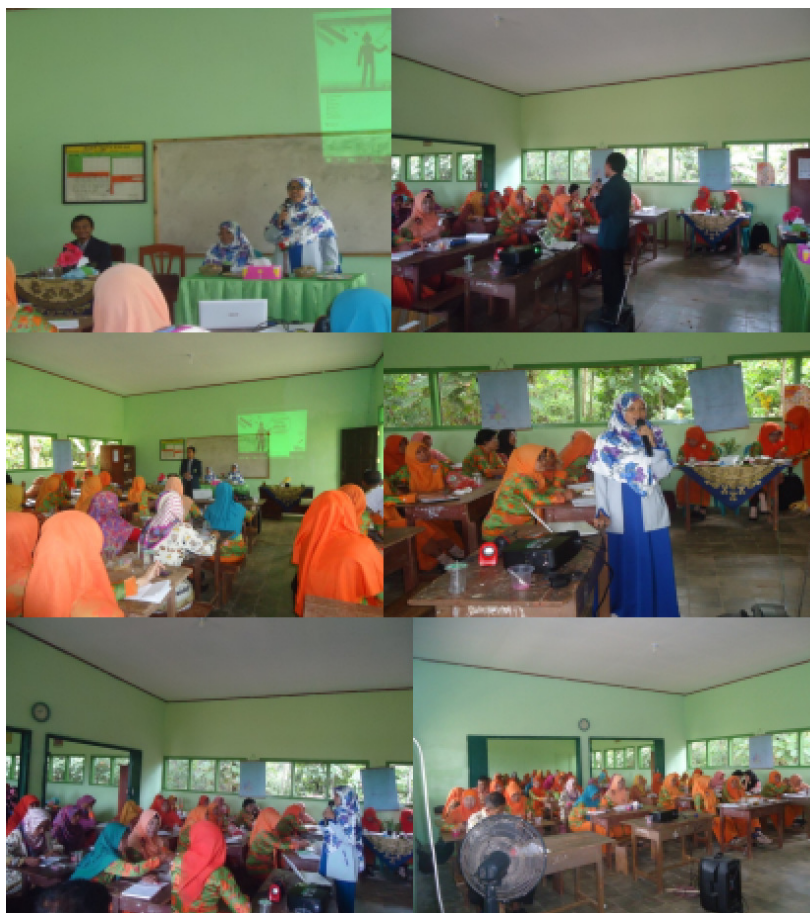
Gambar 8. Suasana Penyuluhan

pada akhir kegiatan peserta masih terlihat antusias. Dalam hal ini tim pengabdian juga akan terus mendampingi jika ada pertanyaan atau permintaan penyuluhan kembali setelah kegiatan berakhir. Berikut adalah bukti otentik berupa dokumentasi yang diperoleh pada saat kegiatan penyuluhan berlangsung di Balai Desa Agung Timur Kecamatan Kalirejo Kabupaten Lampung Tengah.