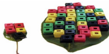
Gambar 7. Memperkirakan Jumlah Benda yang Digunakan untuk Menutup Permukaan Daun