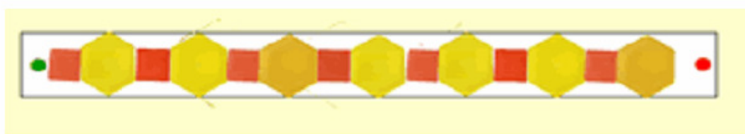
Gambar 1. Mengurutkan pola berdasarkan bentuk

Tujuan mengenalkan pola dan hubungan pada anak tahap berpikir praoperasional adalah mengenalkan dan menganalisa pola-pola sederhana, menjiplak, membuat, dan membuat perkiraan tentang kemungkinan dari kelanjutan pola.